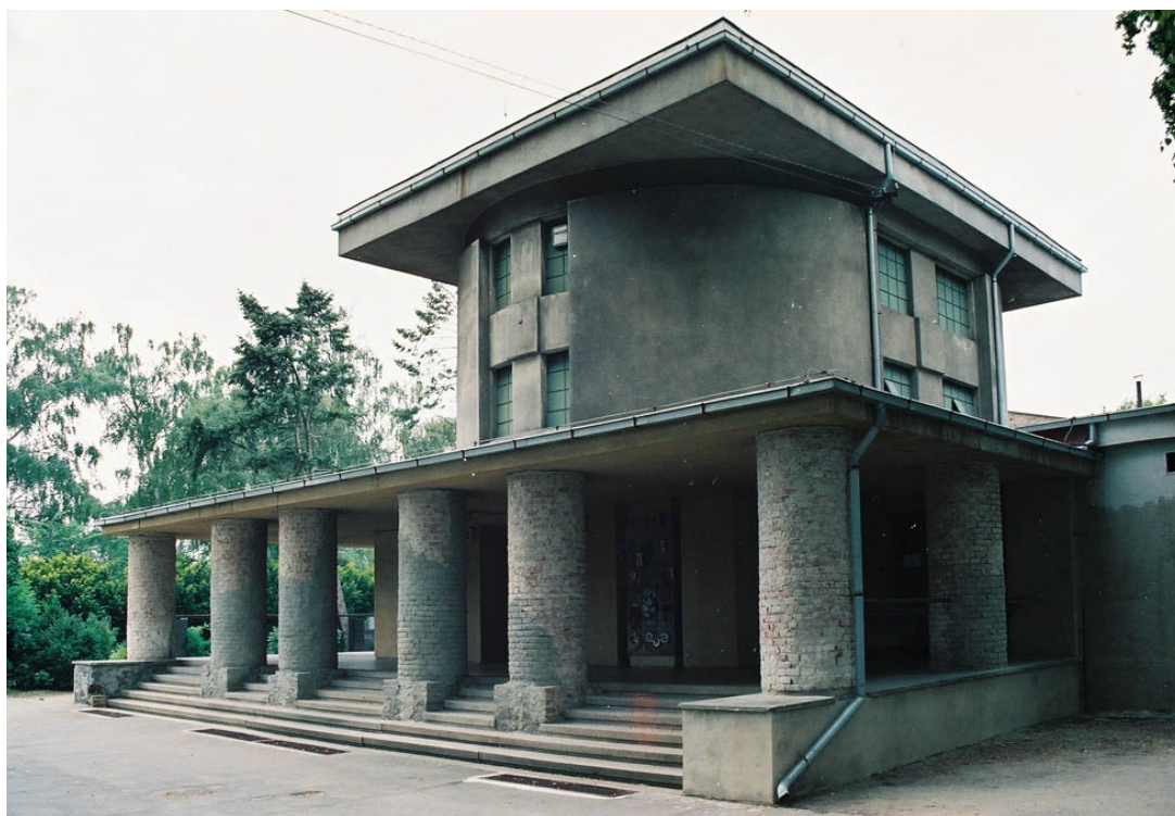
Fotografie z 90. let 20. století. V průhledu mezi pilíři je možné zahlédnout okrovou barevnost pláště budovy, která byla nalezena i v sondách jako poměrně dobře zachovaná vrstva (V3).