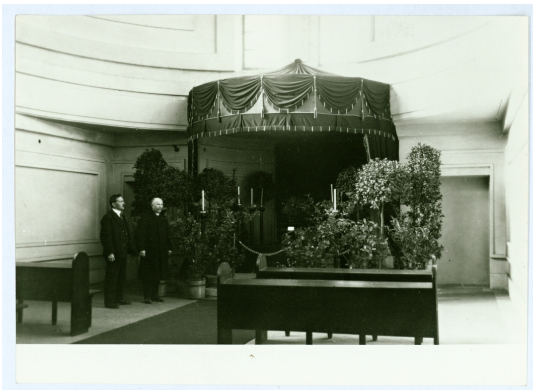
Historická fotografie ukazuje interiér smuteční síně krematoria pravděpodobně nedlouho po otevření svému účelu. Pohledová je pravděpodobně 2. vrstva světlé omítky, označovaná v tomto průzkumu jako O1.